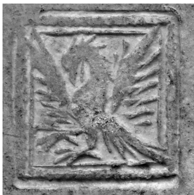
Durchreibung des Stempels mit Vogel-Darstellung. Aus der Werkstatt Lorenz Bell (Originalgröße 15 x 15 mm).

Neben den oben ausführlich besprochenen 92 Spielkarten und einigen Spielkarten-Fragmenten fand sich Pergament-Makulatur aus einem großformatigen Kodex des 15. Jahrhunderts: Geschrieben in Textualis in schwarzbrauner Tinte, mit Initialen, Überschriften und Versalauszeichnung in Rot. Es handelt sich um Fragmente aus einer religiösen Handschrift, die wahrscheinlich im Zuge der Reformation dem Buchbinder zum Opfer fiel. 16 In beiden Deckeln fanden sich zudem zwei Blätter Papiermakulatur aus einer zweispaltig ge-